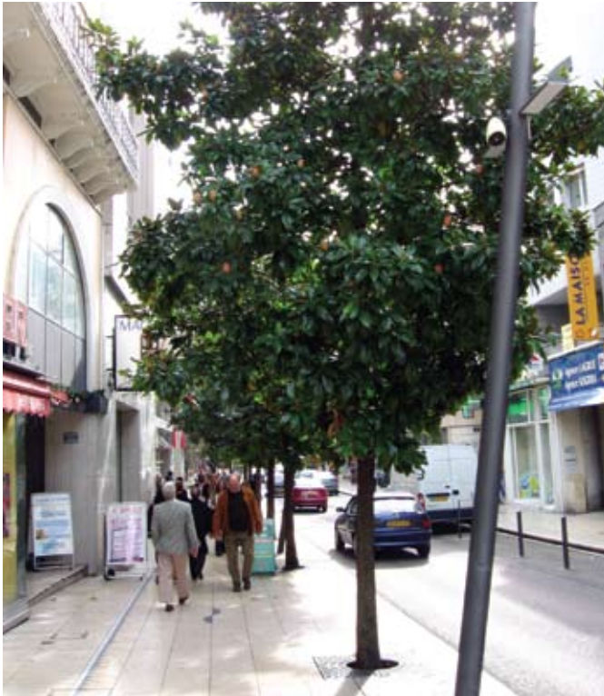
Magnolia grandiflora in een straat van Moulin (Midden-Frankrijk)

daarvoor is, dat er in de opleiding wordt bezuinigd op de kennis van bomen.