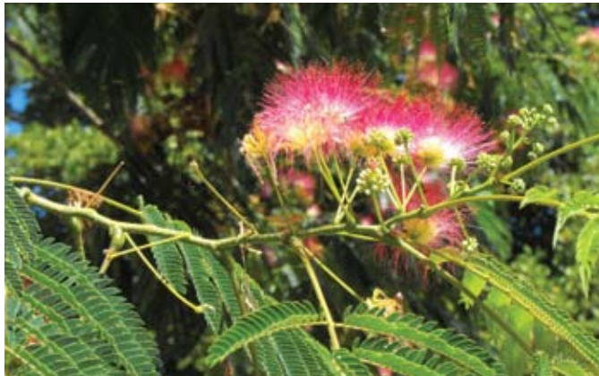
Bloeiwijze van Albizia julibrissin

< Albizia julibrissin te Castellane (Frankrijk)