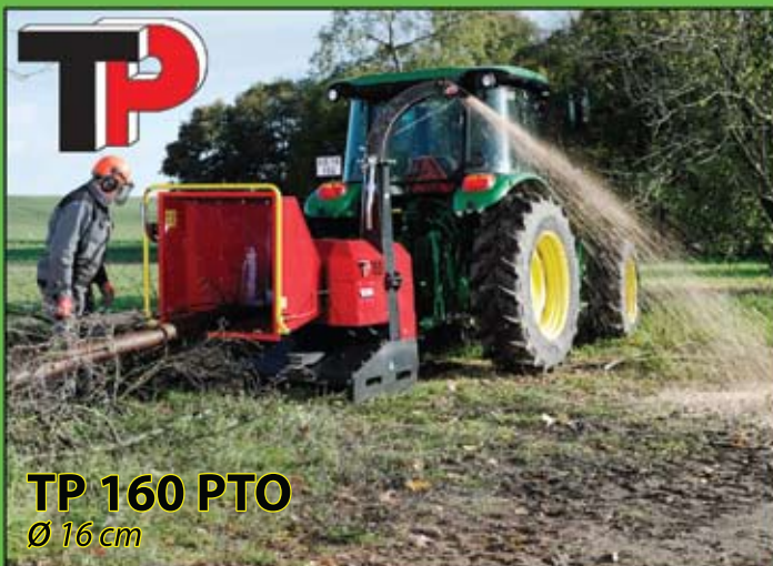
TP 160 PTO Ø 16 cm