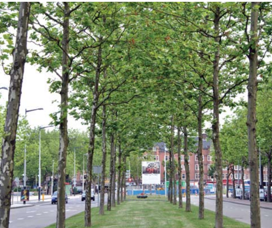
Platanen ( Platanus hispanica ), RAI, Amsterdam