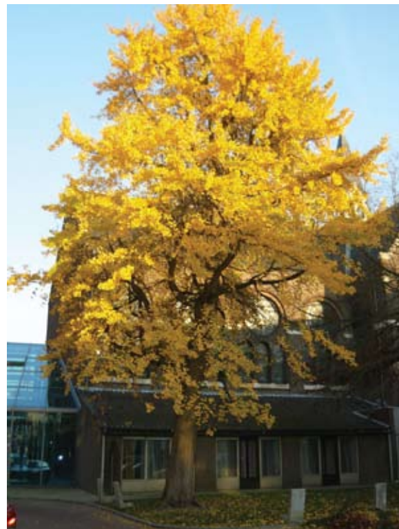
Ginkgo biloba , bij hotel Merlinde, Breda

hebben dan worden de bomen wel ziek, kijk naar onze kastanjes, essen en natuurlijk de iepen.