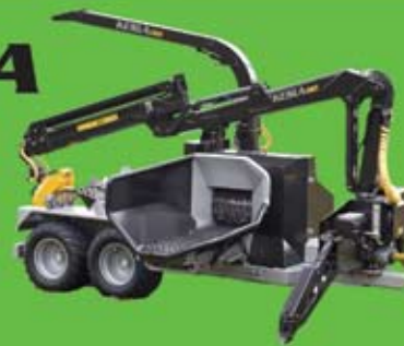
TP 250 Mobile Ø 25 cm